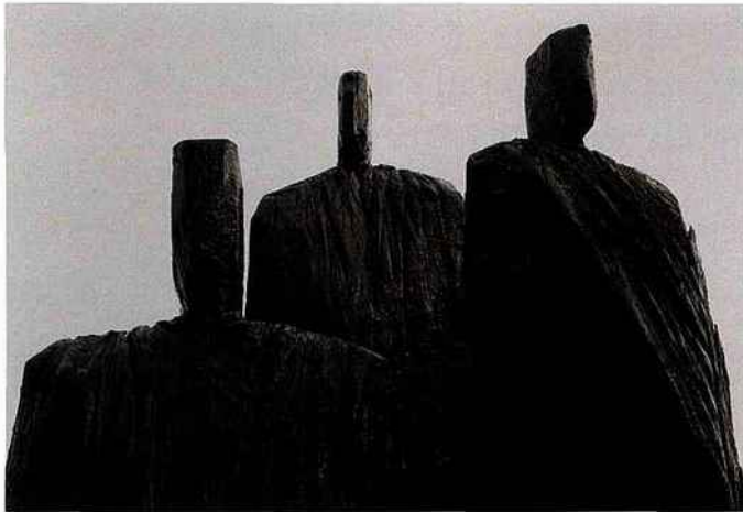
CHRISTIAN LAPIE. L'Écho des ombres , 2014, chêne traité, détail (galerie Guillaume, Paris).