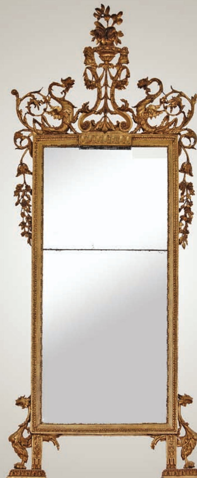
Specchiera Luigi XVI cm 200x80